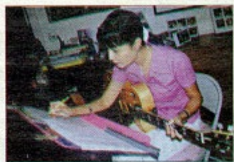
พี่ทะเลค่ะ: ยามว่างของกะทิ

งานอดิเรกอีกชิ้นที่เธอชื่นชอบไม่แพ้กัน คือ อินเทอร์เน็ต "เวลาที่ได้รับของขวัญจากเพื่อนรูปถ่าย หรือของที่ระลึก ทุกอย่างเป็นของที่มีความหมายสำหรับพี่ และเป็นของที่ระลึกจากการเดินทางภาพถ่ายกับเพื่อนๆ หรือคนในวงการเพลง พี่ก็จะเอาของขวัญนี้แหละมาตกแต่งบ้าน ไม่อยากที่บ้านสวย หรือดูดีเกินไป รู้สึกอึดอัด จะหยิบจับอะไรก็กลัวไปหมด เข้าไปอยู่แล้วได้แต่มองอย่างนี้